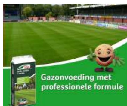
DCM Vital Green (TIP!)