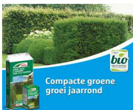
DCM Hagen & Coniferen