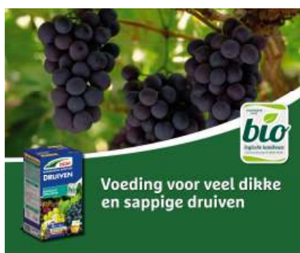
DCM Druiven & Bessen