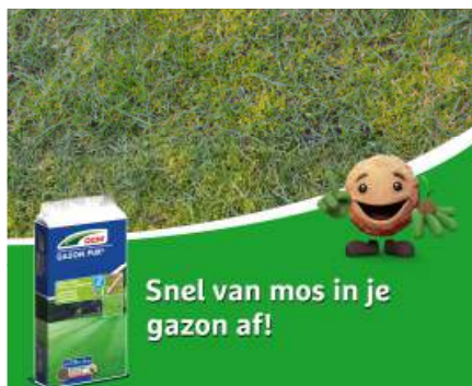
DCM Gazon Pur