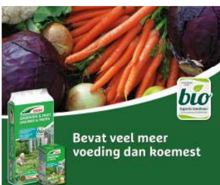
DCM Groenten & Fruit