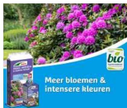
DCM Rhodo / Hortensia / Azalea