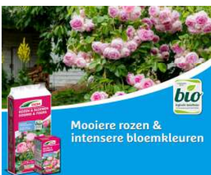
DCM Rozen & Bloemen (TIP!)