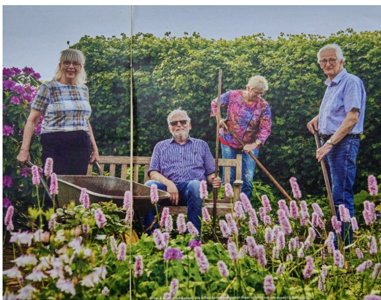
Tijdschrift RABO bank tekst: Marjolein Kaas

Ook de belangstelling voor moestuinieren groeit, ook bij jongere leden. Want er komt steeds meer aandacht voor goede voeding, gezond leven en voldoende beweging. Pilon: 'We zien over de hele linie een kentering in het denken over tuinen: we worden steeds kritischer over gebruik van bestrijdingsmiddelen, kunstmest en zien het belang van drinkwater.' Voor deelnemers aan de moestuincursus is er zelfs een WhatsAppgroep voor vragen. Voor de cursus werken ze samen met de Amateur Tuinders Vereniging in Stadskanaal. De afdeling heeft op eigen verzoek via de Rabo ClubSupport ondersteuning een kennistraject doorlopen, met begeleiding van een professional. Van Velsen: 'We wilden onze vereniging meer toekomstbestendig maken: niet blijven doen wat we altijd al deden, maar nieuwe impulsen krijgen.' Dankzij een enthousiaste klankbordgroep kwamen nieuwe ideeën over de vereniging concreet in beeld; na toetsing bij de leden bleken die positief. Nieuw beleid wordt nu al uitgevoerd. Zo hebben we een moestuincursus en we stimuleren bijvoorbeeld het bloemschikken. We werken al samen met de bibliotheek maar er zijn nog meer mogelijke partners, bijvoorbeeld IVN, Staatsbosbeheer en de gemeente. We willen als vereniging midden in de maatschappij staan!